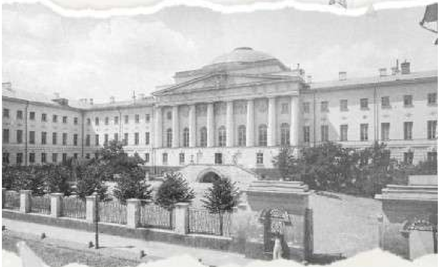
Московский и Киевский университеты